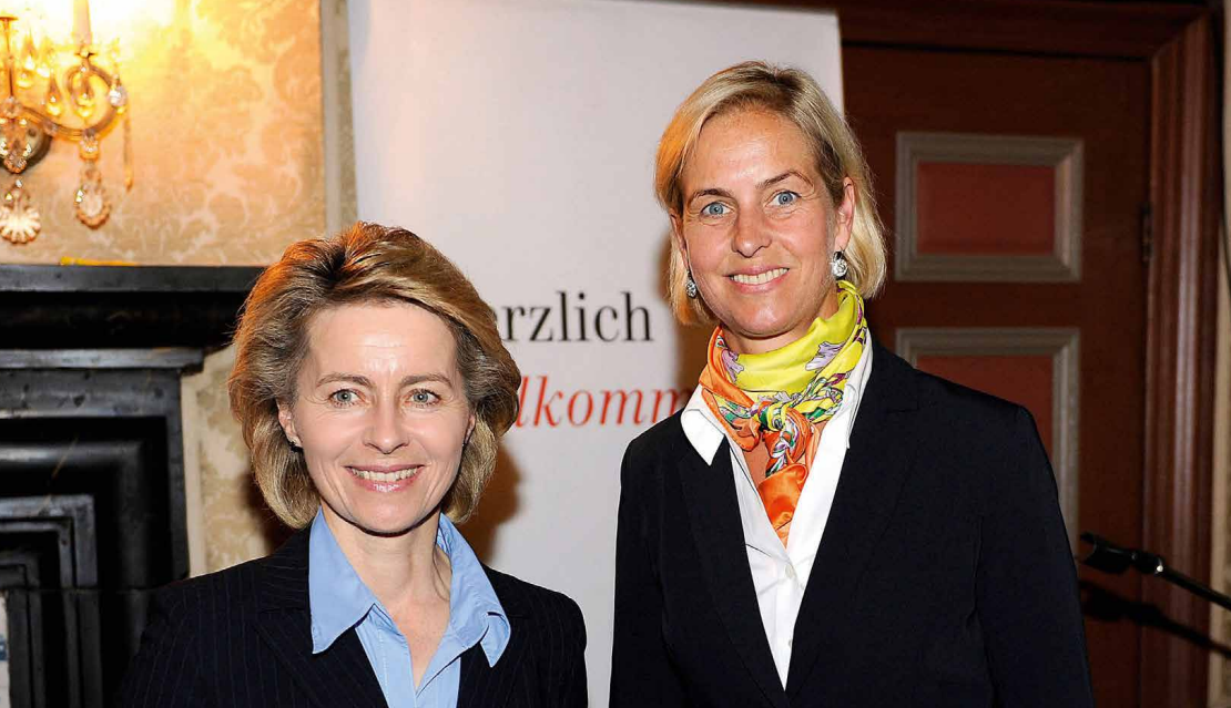
Dr. Ursula von der Leyen MdB